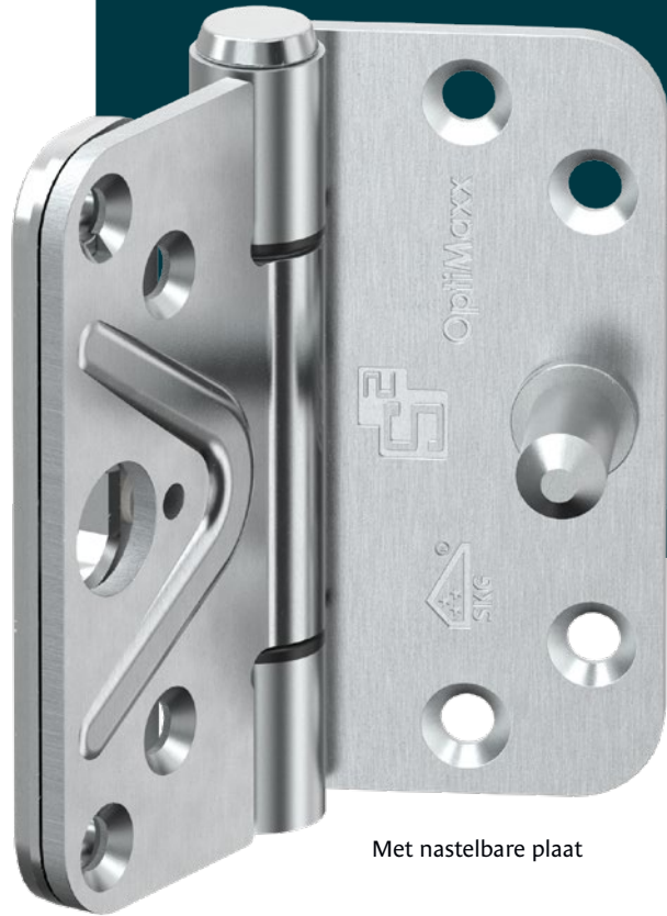
Met nastelbare plaat

Het nastelbare scharnier heeft een metalen stelplaat achter het scharnierbled. Met een 3 mm inbussleutel draait u de stelschroef richting het kozijn of juist van het kozijn af. Door het stellen verandert de hang- en sluitnaad, waardoor de deur weer optimaal sluit.