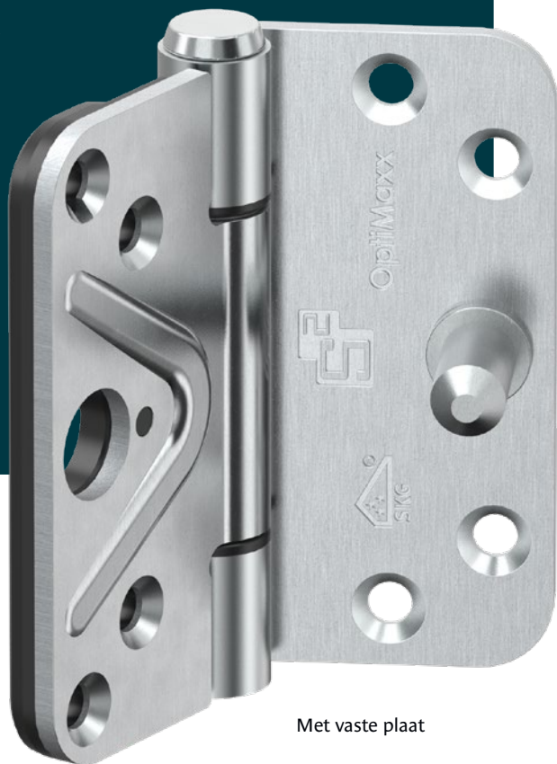
Met vaste plaat